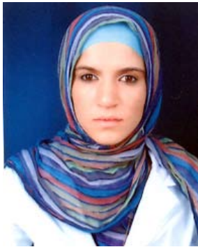
ئامادەکردنى: دەشنى حەيدەر داود