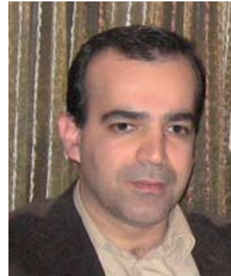
به شى پينچم