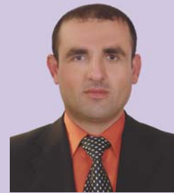
نهنداز یار هاوار غفور حمد امین

خزمه تگوزاری (VOIP) که تا دیت زیاتر ده بیټ وه چاوه روان ده کریت له داهاتوویکی نزیکدا زۆرتر به کار بهیندریت.