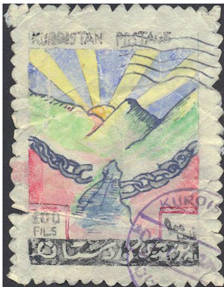
یه کیگ له و پولانه ی له ناوچه کانی زیر ده سته لاتی شورشی نه بلول کاری پن کراوه و له لایه ن شورته وه چاپ کراوه

ژماره یه کی دیاری کراوه له هه ر پولیک که بلاو ده کریته وه و نه م ژماره یه به شیوه یه کی فه رمی له لایه ن بهرپراسنی فه رمانگه ی پوسته راده گه ینریت.